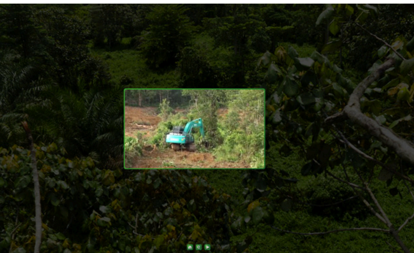
Panorama desde el nido del orangután, www.vEcotourism.org