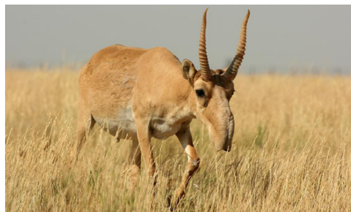
Antilope Saiga

El Centro de recursos sobre el saiga (SRC) es un nuevo sitio web patrocinado por Suiza y por el Programa de pequeñas donaciones de la CMS. El SRC se ha establecido por iniciativa de la Alianza para la conservación del saiga (SCA) y la Asociación para la conservación de la biodiversidad de Kazajstán (ACBK), como foro para compartir la información sobre el saiga con las personas que estuvieran interesadas por esta especie migratoria importante. Además, el sitio web sirve como mecanismo de coordinación internacional para la aplicación del MdE sobre el saiga. El sitio se ha diseñado de manera que se proporcione información a una amplia variedad de usuarios, desde el público en general a los