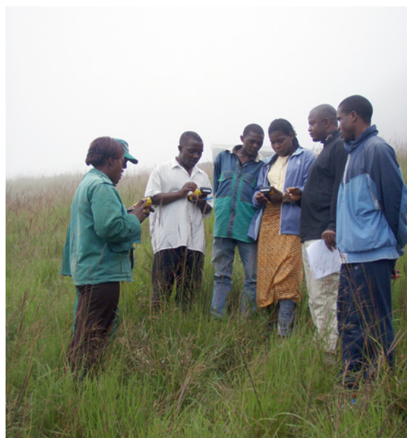
Conservación y planificación basada en la comunidad para el gorila del río Cross

La CMS ha financiado a través de su Programa de pequeñas donaciones un proyecto en Nigeria y Camerún sobre la conservación del gorila occidental del río Cross ( Gorilla gorilla diehli ) y su hábitat, que se encuentran en grave peligro de extinción. Con menos de 300 ejemplares que viven en su medio natural, el gorila occidental del río Cross es la especie de grandes simios de África menos conocida y más amenazada. Su población solo se ha encontrado en una reducida zona montañosa a caballo de la frontera entre Camerún y Nigeria. El hábitat del gorila occidental del río Cross se limita a un paisaje complejo formado por bosques fragmentados, muchos de los cuales no están protegidos oficialmente por el momento. La caza y la creciente demanda de productos agrícolas y forestales constituyen las principales amenazas a esta especie y su hábitat restante.