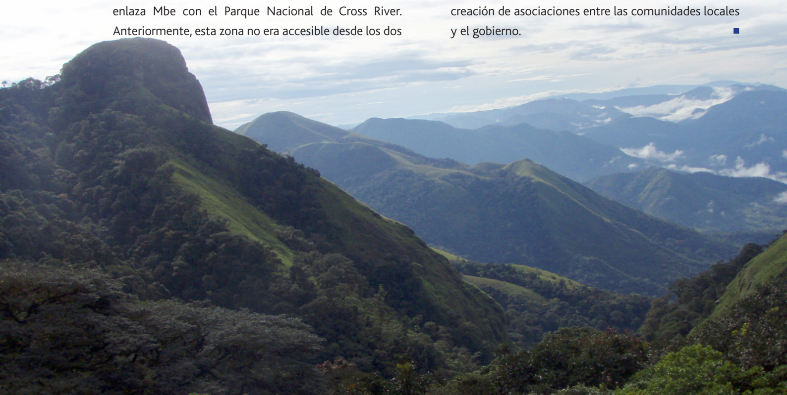
Hábitat del gorila del río Cross

Los antiguos cazadores de los bosques administrados por la comunidad en el área de distribución de la especie participaron en las sesiones de capacitación destinadas ayudarles a obtener medios de vida alternativos. En particular, se realizaron sesiones de capacitación en apicultura, para generar fuentes alternativas de ingresos para ellos. Se construyeron en total 117 colmenas horizontales kenyanas para respaldar estas actividades. Varios cazadores entregaron voluntariamente sus armas al final de las sesiones de capacitación para mostrar su compromiso. De este modo, la financiación de la CMS ha contribuido a mejorar considerablemente los medios de vida de la población local y a fomentar la creación de asociaciones entre las comunidades locales y el gobierno. ■