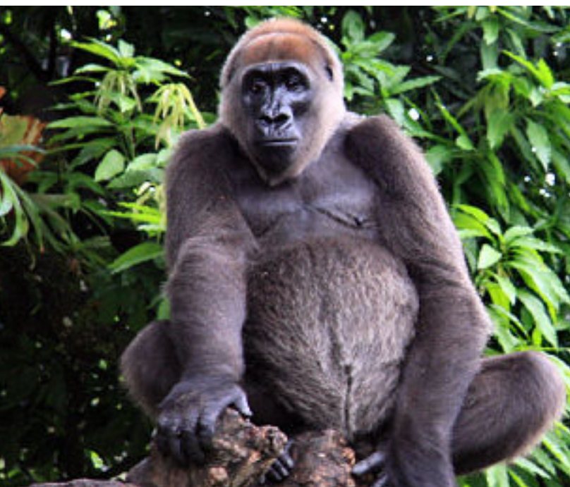
Gorila occidental del río Cross, Limbe Wildlife Centre, Camerún.

La CMS ha financiado este proyecto llevado a cabo en Nigeria y Camerún del 1º de febrero de 2012 al 30 de junio de 2013, para hacer frente a estas amenazas. El proyecto centró la atención, como objetivo principal, en la conservación basada en la comunidad de los bosques situados en las zonas no protegidas importantes del área de distribución de la especie.