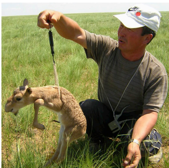
Pesaje de terneros saiga

La sección tal vez más importante del sitio es la relativa a los recursos especializados. Esta parte del sitio, de acceso protegido con contraseña, se ha reservado para uso de los profesionales del saiga, con objeto de facilitar