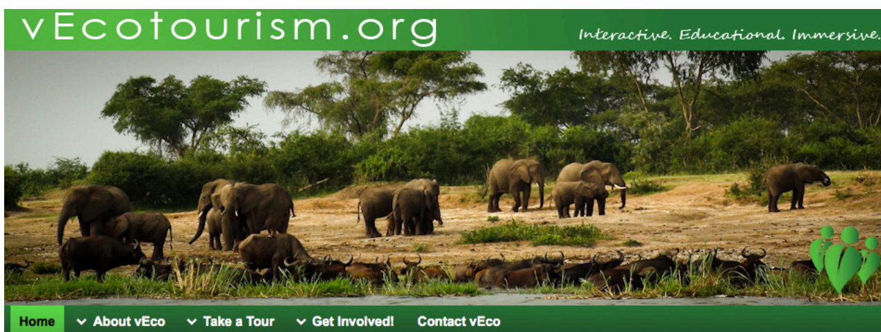
Sitio web de www.vEcotourism.org