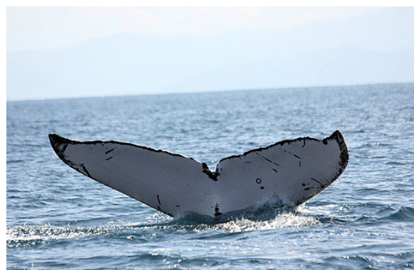
Aleta de ballena jorobada ( Megaptera novaeangliae )

grupo, tamaño del grupo, distancias que las ballenas mantienen entre ellas, superficie aproximada que ocupa el grupo y presencia de crías y juveniles. Se toman fotografías para identificar a los individuos mediante las marcas visibles en la superficie ventral de sus aletas y la forma de la aleta dorsal. Esto ayuda a determinar los modelos de distribución y reconocer las zonas marinas que suscitan especial preocupación. Además, la Fundación Keto imparte capacitación a los miembros de la comunidad y a los operadores turísticos para asegurar la investigación continua, con el fin de establecer un conjunto de datos a largo plazo en el futuro. Durante los avistamientos se toma nota también del número y tipos de embarcaciones utilizadas por los operadores de avistamiento de ballenas y la respuesta de éstas a las embarcaciones que se acercan.