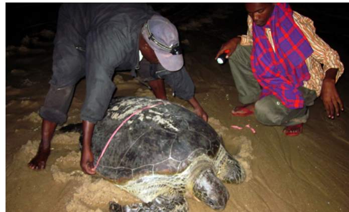
Medición de la longitud curva del caparazón