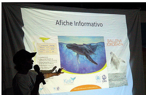
Charlas educativas

grupo, tamaño del grupo, distancias que las ballenas mantienen entre ellas, superficie aproximada que ocupa el grupo y presencia de crías y juveniles. Se toman fotografías para identificar a los individuos mediante las marcas visibles en la superficie ventral de sus aletas y la forma de la aleta dorsal. Esto ayuda a determinar los modelos de distribución y reconocer las zonas marinas que suscitan especial preocupación. Además, la Fundación Keto imparte capacitación a los miembros de la comunidad y a los operadores turísticos para asegurar la investigación continua, con el fin de establecer un conjunto de datos a largo plazo en el futuro. Durante los avistamientos se toma nota también del número y tipos de embarcaciones utilizadas por los operadores de avistamiento de ballenas y la respuesta de éstas a las embarcaciones que se acercan.