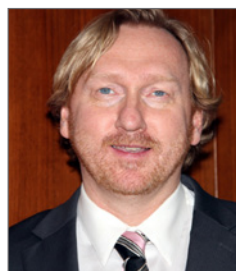
Dr. Bradnee Chambers

dirigir su mirada hacia los principales logros obtenidos por lo que respecta a la conservación de las ballenas y los albatros que migran a la región antártica. Las Partes en la Convención pueden hacer una importante contribución a la mejora del estado de conservación de las especies marinas de la Antártida, cumpliendo plenamente con su obligación de proteger a las especies migratorias incluidas en el Apéndice I y su hábitats. ■