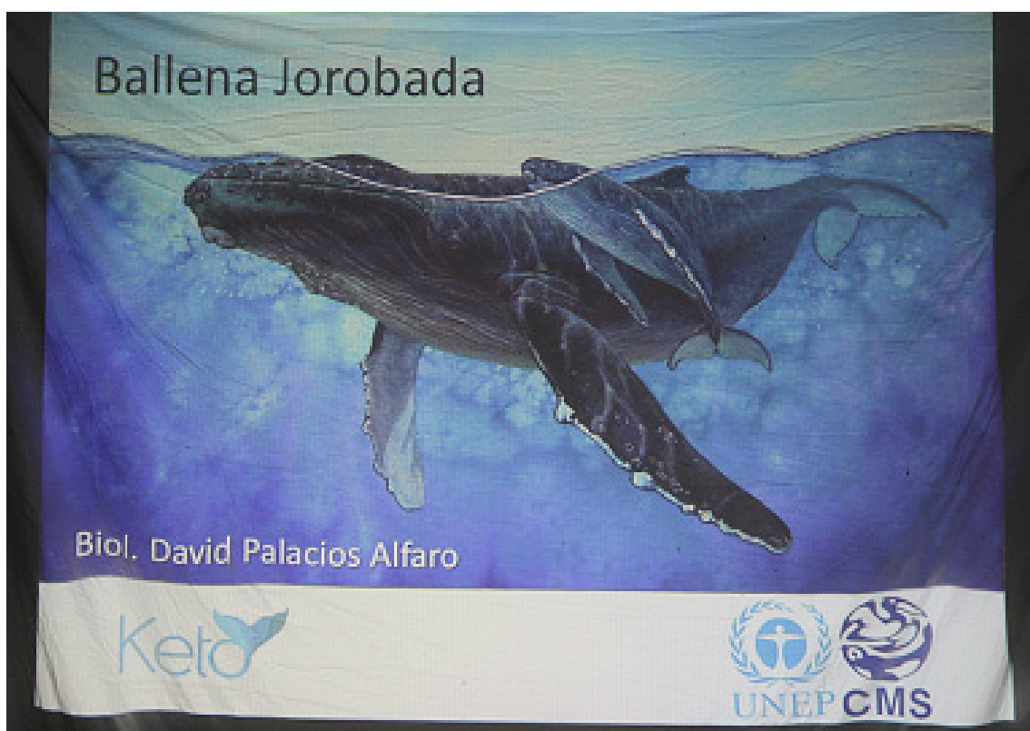
Cartel con ballenas jorobadas ( Megaptera novaeangliae )

En las encuestas sobre las ballenas jorobadas, se toma nota de la siguiente información: fecha, tiempos de inicio y terminación de la encuesta, posición geográfica, tipo de motor de la embarcación utilizada para la encuesta, estado del mar, comportamiento del