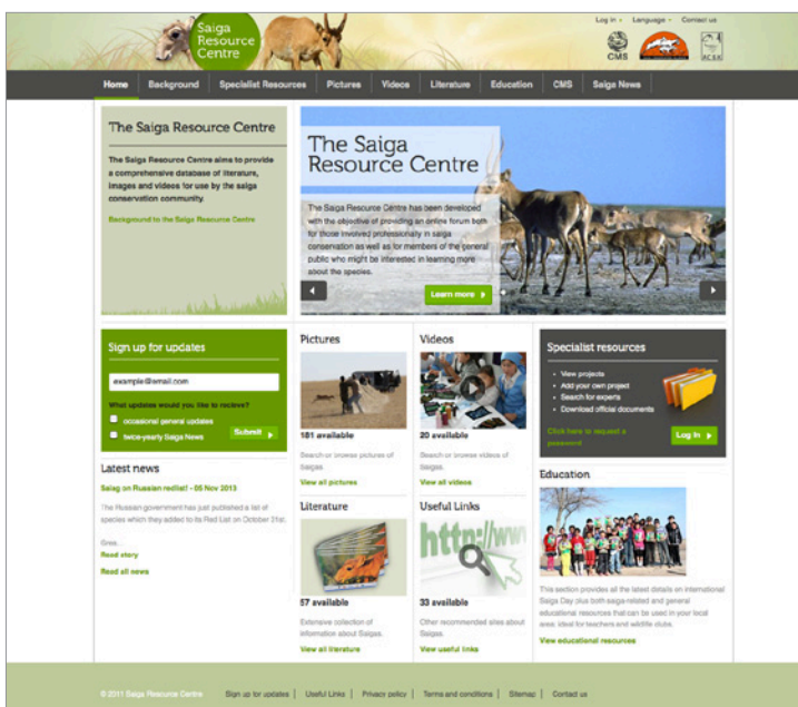
Sitio web del Centro de recursos sobre el saiga, http://www.saigaresourcecentre.com/

El sitio desempeña ahora varias funciones fundamentales. La primera es la de presentar el saiga y su estado de conservación, de forma que llegue a una amplia variedad de usuarios. Quienes descubren por primera vez el antilope saiga pueden aprender sobre la especie