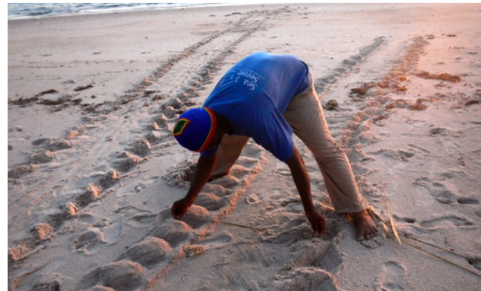
Medición de huellas de tortuga para identificar especies en anidación

El proyecto financiado por la CMS en Tanzania se propone colmar esta carencia de datos. Se está llevando a cabo durante la temporada alta de anidación, y de su ejecución se está ocupando Sea Sense en colaboración con la División de Desarrollo Pesquero del Gobierno de Tanzania. Sea Sense es la única ONG dedicada a la conservación y protección del medio ambiente marino en Tanzania.