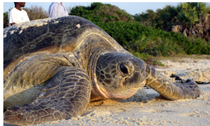
Hembra que vuelve al mar después de la anidación