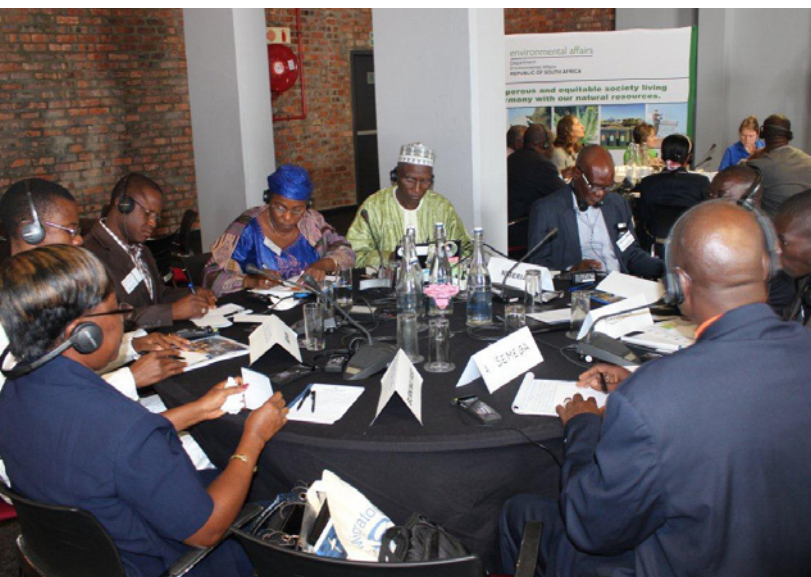
Taller de creación de capacidad en Sudáfrica

El taller conjunto de la CMS y el AEWA sobre el Manual para los Puntos Focales Nacionales de África (PFN) se celebró del 29 al 31 de octubre en Ciudad del Cabo (Sudáfrica). Participaron en total, en el taller, 45 delegados de 26 países africanos que son Partes en la Convención.