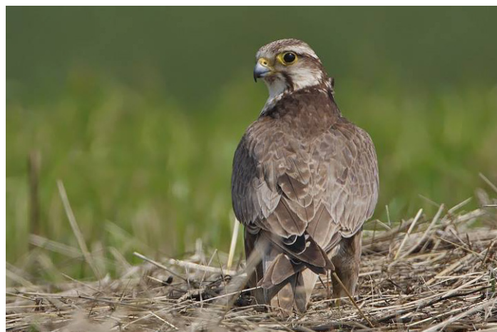
Halcón sacre ( Falco Cherrug )

Además, los delegados solicitaron diez hospitales para