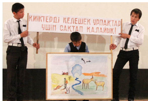
Campaña de educación en las escuelas de Uzbekistán

el intercambio de información. Los funcionarios de los gobiernos, las ONG, los expertos, así como las personas interesadas que participan en la conservación del saiga tendrán acceso a esta sección y la posibilidad de agregar sus propios conocimientos especializados y proyectos. Además, pueden acceder a la herramienta de presentación de informes en línea y la información de la CMS sobre otras actividades y expertos.