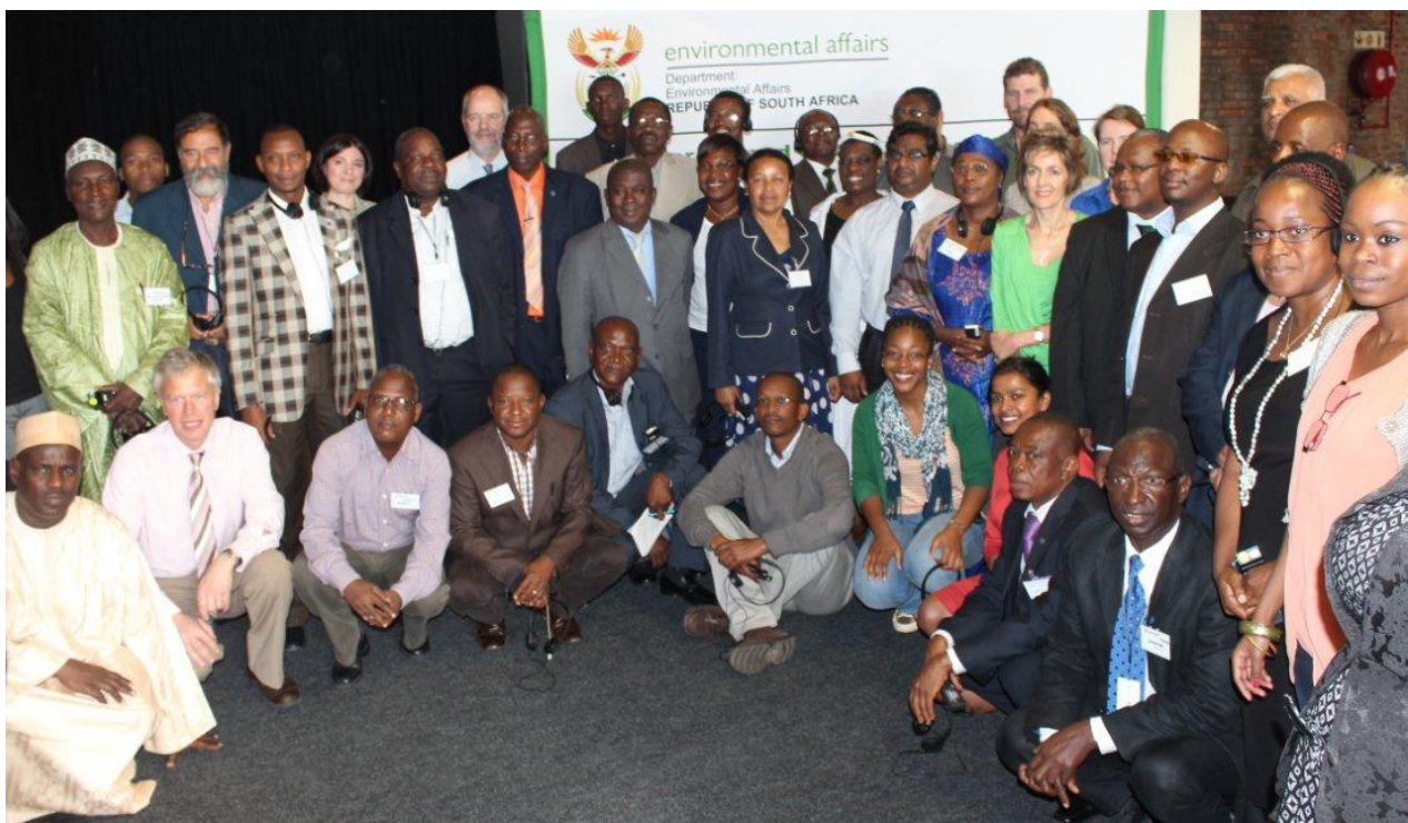
Grupo de participantes, Taller de creación de capacidad en Sudáfrica

Los seis días de reuniones de la familia de la CMS han contribuido en medida considerable a fortalecer la capacidad de los PFN para los instrumentos de la familia de la CMS, con objeto de aplicar eficazmente la CMS, el AEWA y otros instrumentos de la familia de la CMS en la región de África. ■