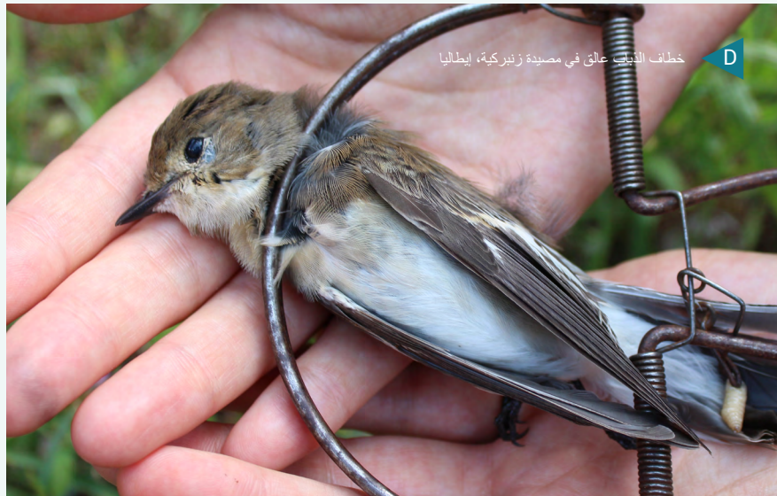
خطاف الدباب عالق في مصيدة زنبركية، إيطاليا

يستخدم عدد كبير من الفخاخ المختلفة في جميع أنحاء البحر الأبيض المتوسط لاصطياد الطيور. تُوضع طعوم في المصائد الزنبركية، وتُعلق عندما يخطو عليها الطائر، مما يؤدي إلى قتله. تستخدم المصائد الحجرية لوحًا كبيرًا من الحجر مدعومًا بالعصي التي تسقط عندما يخطو الطائر عليها، مما يؤدي إلى سحق الطائر.