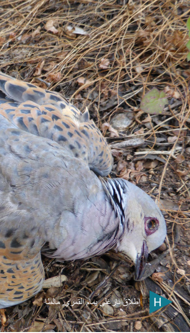
إطلاق نار على بوم القمري مالمط