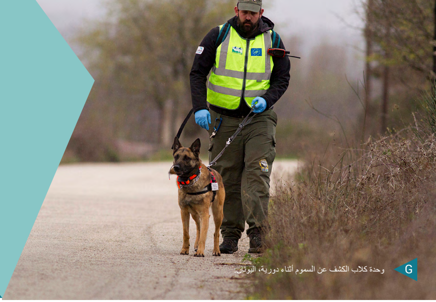
وحدة كلاب الكشف عن السموم أثناء دورية، اليونان.