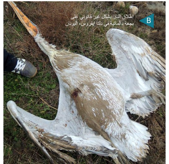
إطلاق النار بشكل غير قانوني على بجة دالماتية في دلتا إيروس، اليونان

قد يشمل ذلك إطلاق النار على الأنواع المحمية، مثل الطيور الجارحة أثناء الهجرة أو إطلاق النار على الأنواع القابلة للصيد خارج موسم الصيد، مثل صيد البمام القمري الأوراسي في الربيع.