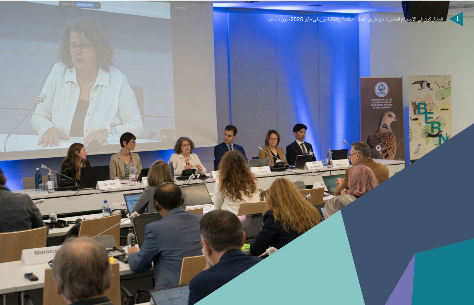
المشاركون في الاجتماع المشترك بين فريق العمل "ميكت" واتفاقية برن في مايو 2025، بون، ألمانيا.

تُعد معالجة القتل غير القانوني للطيور المهاجرة والاتجار بها أمرًا صعبًا ويختلف من منطقة إلى أخرى. تشمل العوامل التي تساهم في ذلك القوانين غير الواضحة، وضعف الإنفاذ، والممارسات الثقافية، والفقر، ودوافع الربح، وانخفاض الوعي. تتطلب الحلول اتباع أساليب مبتكرة وتعاونًا وثيقًا بين جميع الأطراف المعنية.