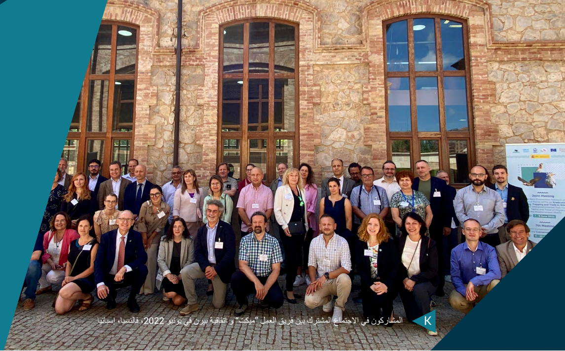
المشاركون في الاجتماع المشترك بين فريق العمل "مكتت" واتفاقية برن في يونيو 2022، فالنسيا، إسبانيا