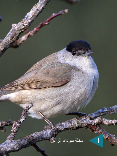
دخلة سوداء الرأس

في الوقت نفسه، تم التعامل مع "الضغط غير المستدام للصيد على طائر القمري الأوراسي" بشكل منهجي على مستوى الاتحاد الأوروبي منذ ذلك الحين، وحقق بعض النجاحات الملحوظة في مسار هجرة الطيور الغربي.