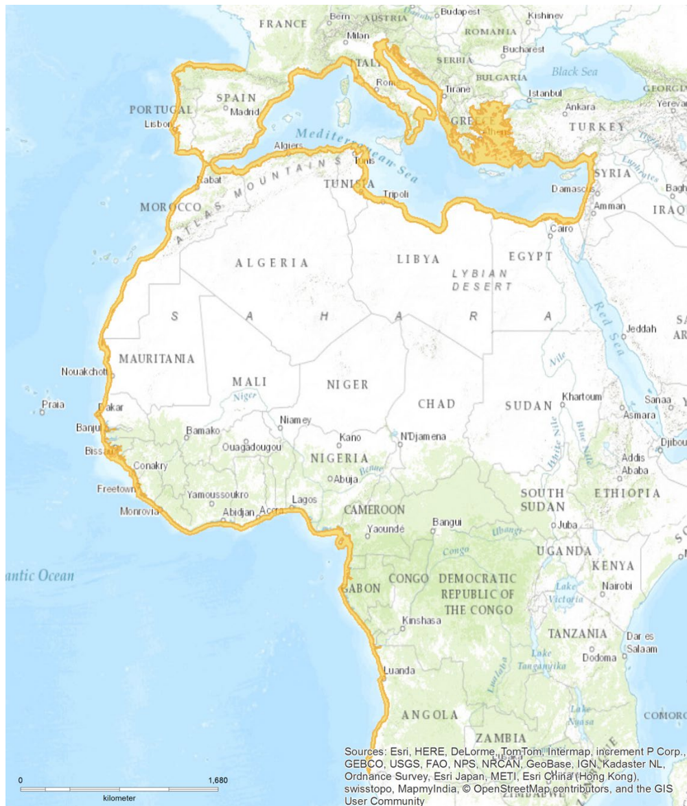
Figura 1: Área de distribución del pez guitarra común ( Rhinobatos rhinobatos ) https://www.iucnredlist.org/species/63131/12620901