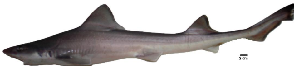
Figura 1. Mustelus schmitti (gatuso)

Portugués: cação-cola-fina; cação-perna-de-moça, caçonete