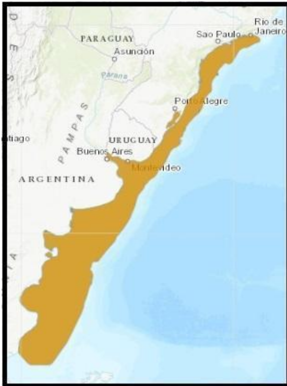
Figura 2. Distribución del Mustelus schmitti .