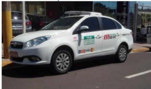
Campo Grande – Taxi