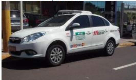
Campo Grande – Taxi