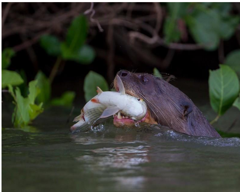
Giant river otter with fish, Pantanal, Brazil