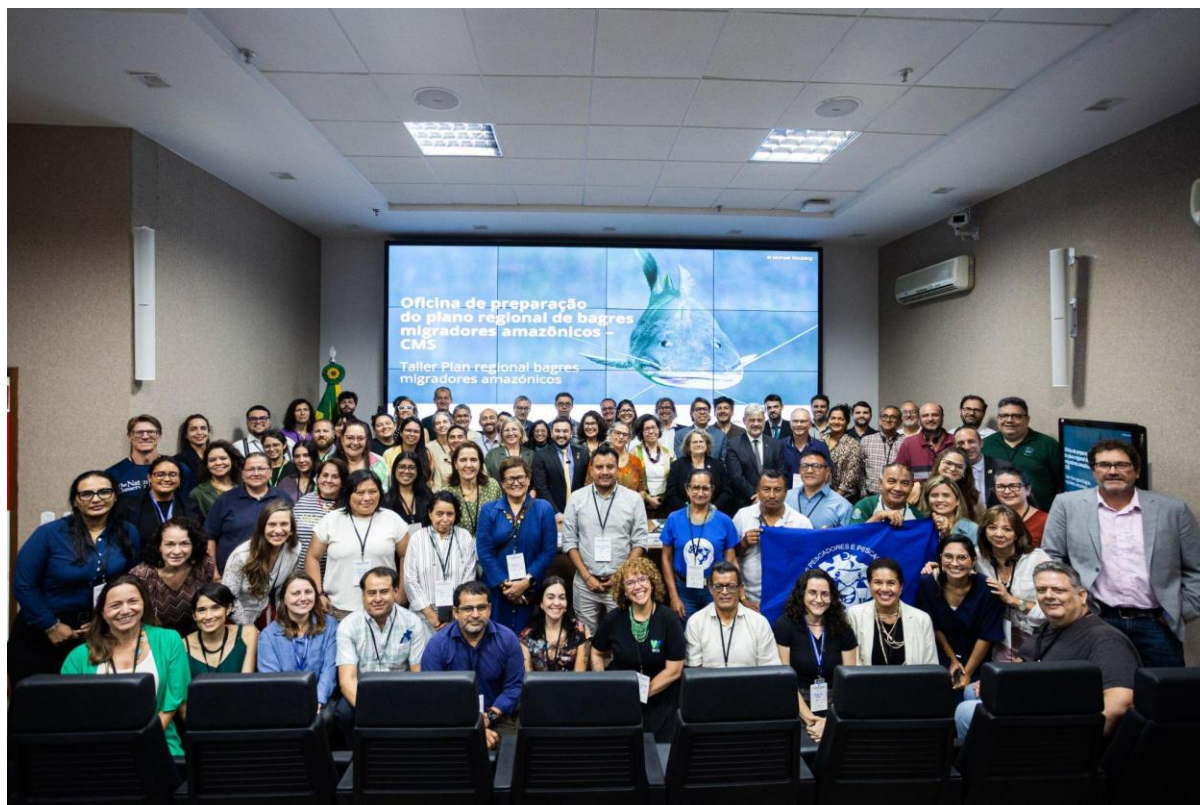
Photo 1. Atelier régional pour la préparation du Plan d'action. Brasilia, 2025