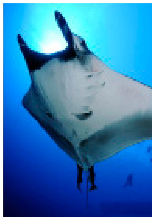
Manta raya