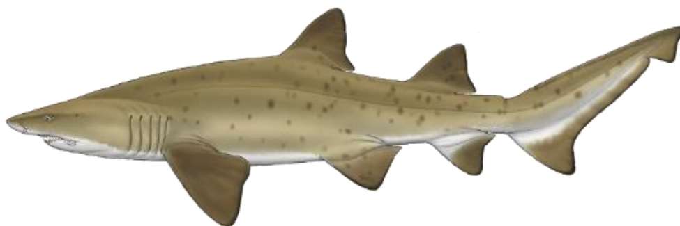
Figure 1 : Illustration adaptée des guides d'identification des requins (Marc Dando - The Shark Trust)

Escalandrún (Argentine), Mangona (Brésil), Sarda (Uruguay),