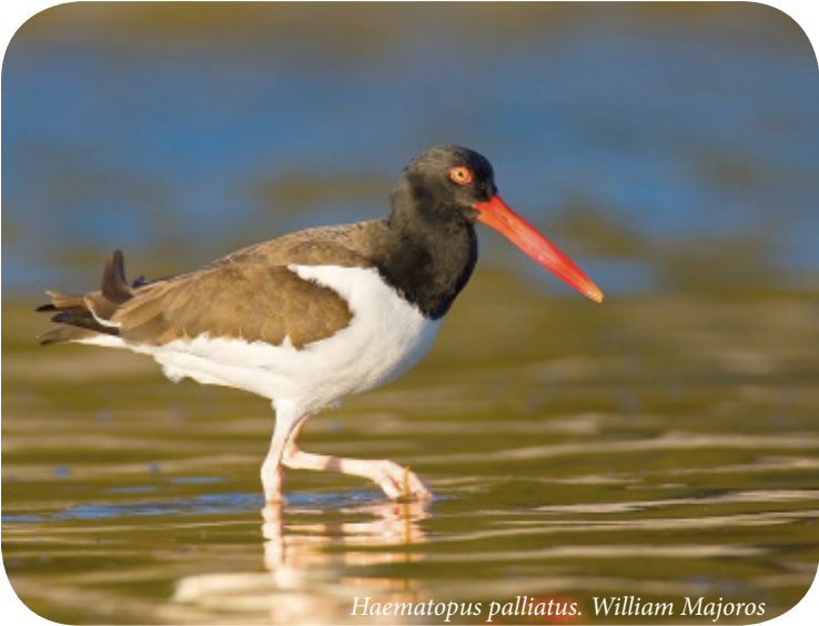
Haematopus palliatus. William Majoros

Resumen Ejecutivo La iniciativa del Corredor de Aves Playeras del Atlántico es la culminación de un esfuerzo de tres años que involucra múltiples socios a través de todo el Corredor del Atlántico. Liderada por el Servicio de Pesca y Vida Silvestre de los Estados Unidos USFWS para enfrentar la disminución de las poblaciones de las aves playeras, esta iniciativa se desarrolló para trabajar en la conservación de estas aves en todo su ciclo de vida y representa el conjunto completo de acciones y estrategias necesarias para conservar quince especies de aves playeras del Corredor del Atlántico, así como a otras especies presentes en los mismos hábitats.