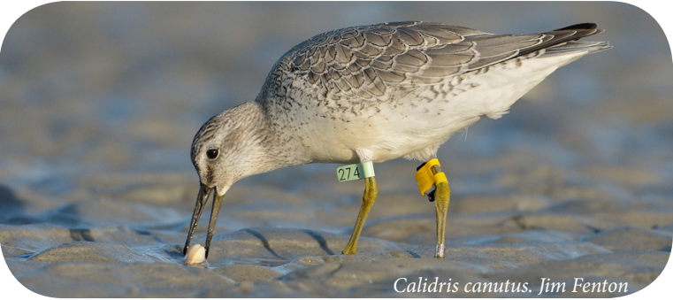
Calidris canutus. Jim Fenton

Las aves playeras son vulnerables a muchas amenazas en su ruta migratoria. Tales amenazas aumentan por la combinación de sus preferencias en los hábitats de anidación (cambiantes ambientes árticos y costeros), estrategias de historia de vida (baja tasa reproductiva, migraciones de larga distancia) y demografía (poblaciones pequeñas).