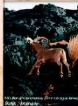
Mammifère ( Antelope ) Statut : "P"