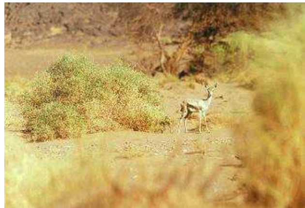
Jeune Dorcas, Tendjedj Montains, Ahaggar National Park. Algeria.

Enfin, toute réintroduction/ renforcement devrait être précédé d'une analyse génétique globale des diverses souches nationales, sauvages et semi-captives, afin de s'assurer du bien fondé de l'action (Cuzin 2003).