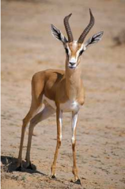
Gazella dorcas.