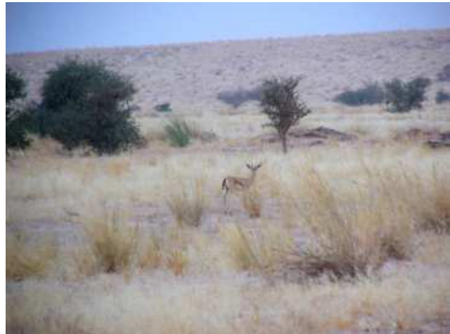
Gazella dorcas . Sud-Tamesna.Mali 2004.