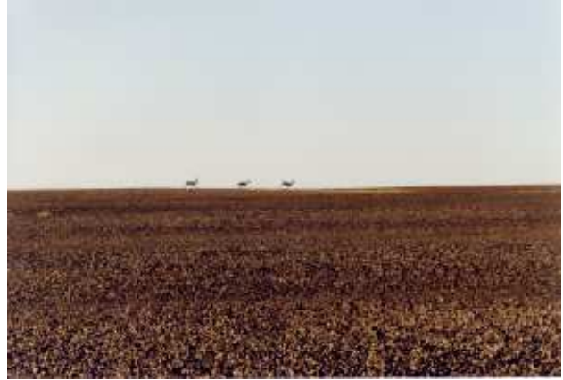
Gazella dorcas . Nord-Tamesna. Mali. 2002

Protégé ou partiellement protégé au Maroc, en Algérie, Tunisie, Libye, Egypte, Mali, Soudan, Burkina Faso, Nigéria, Ethiopie, Somalie