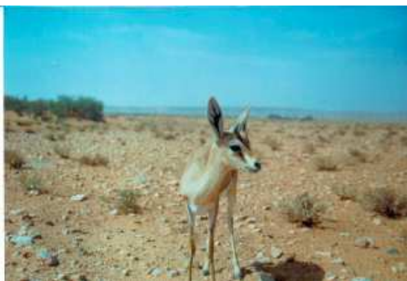
Jeune Dorcas dans l'enclos d' El Bayad. Algérie. 2000.

A la possible exception des dunes dans le Sud-Ouest (i.e. Erg Chech et Erg d'Igudi), la Gazelle dorcas se rencontrait historiquement à travers toute l'Algérie (Lavauden 1926, Dupuy 1967, De Smet 1988, Kowalski et RzebiK-Kowalska 1991). Il reste quelques doutes sur la validité des observations du XIXe siècle de la région côtière méditerranéenne, en raison de la confusion possible avec la Gazelle de Cuvier (Kowalski et RzebiK-Kowalska, 1991), mais étant donné la fréquence de l'espèce dans d'autres régions côtières ailleurs dans son aire, il est probable que ces données étaient valides.