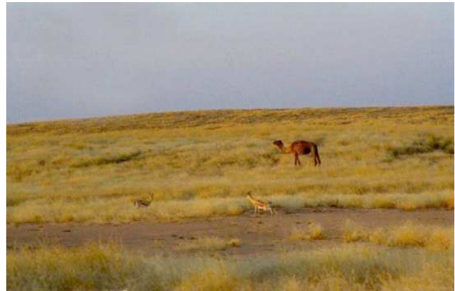
Gazella dorcas . Réserve du Ouadi Rimé-Ouadi Achim Tchad. 1999.

A la fin des années 1970, la Gazelle dorcas était distribuée à travers tout le Tchad au Nord de 13°30' de latitude Nord (Newby, 1981a), et cette zone représente sans doute l'aire de distribution historique de l'espèce au Tchad. Elle ne se trouve pas dans les hauts massifs (Thomassey et Newby, 1988), mais ailleurs sa distribution était probablement uniforme. A la fin des années 1970, la population de la Réserve de Ouadi Rimé-Ouadi Achim était estimée à 35.000-40.000 individus, la surface de la réserve représentant environ un quart de l'aire de distribution de l'espèce au Tchad (Newby, 1981a). En dépit d'une pression de chasse intense, en particulier durant la guerre civile, la Gazelle dorcas est restée largement distribuée au Tchad tout au long des années 1980; les estimations de populations étaient alors descendues à quelques dizaines de milliers (Thomassey et Newby, 1990).