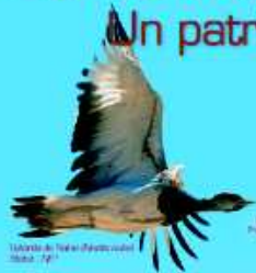
Talipot de l'Inde ( Accipiter talar ) Statut : "P"

L'UNESCO a inscrit récemment dans son Liste du Patrimoine Mondial le Massif de Termit au Niger. Ce site est unique en Afrique de l'ouest et constitue un véritable trésor naturel et culturel. Le Massif de Termit est une zone protégée qui abrite une faune exceptionnelle et une flore rare. C'est un lieu idéal pour observer la nature et découvrir les richesses du Niger.