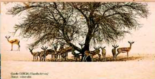
Gazelle ( Gazelle gazelle ) Statut : "P"