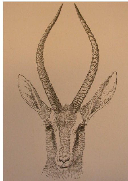
Gazella Dorcas. Mâle. in P.L. Sclater & Thomas. 1897. The book of Antelopes.