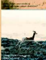
Caprin ( Capra ibex ) Statut : "P"