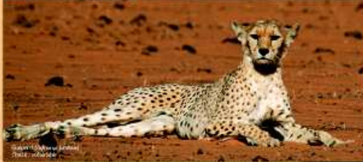
Guépard ( Acinonyx jubatus ) Statut : "P"