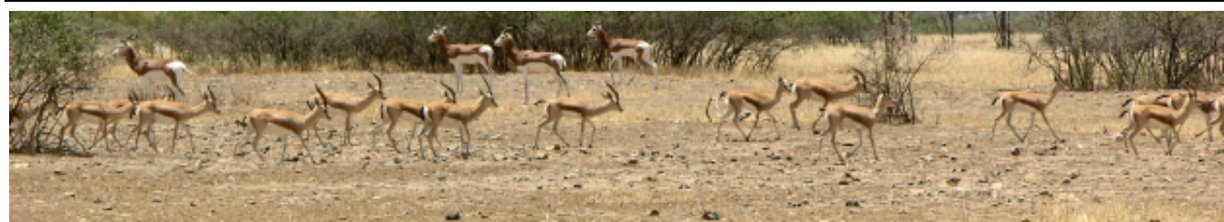
Groupes de Gazelles Dorcas et de Gazelles Dama Mohor (arrière plan). Réserve de R'Mila, Maroc. 2004