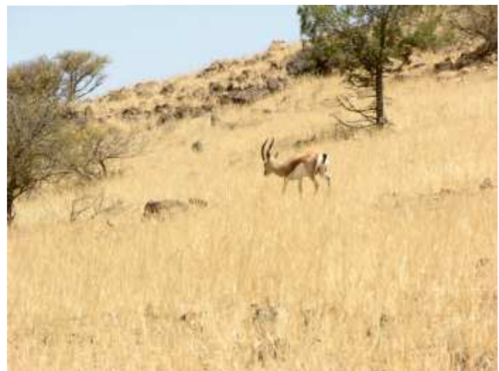
Gazella Dorcas . Jbilet, Maroc. 2004