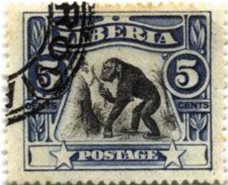
Figura 2. Sello postal de Liberia que ilustra el uso de herramientas por parte de los Chimpancés, 1906.

En la reunión inicial expuesta anteriormente se explorarán las vías para este objetivo. Las oportunidades convencionales las ofrece la prensa escrita, la televisión e Internet, teniendo en cuenta que, si bien los ordenadores y las tabletas pueden ser relativamente poco frecuentes en particular en contextos rurales, los teléfonos móviles con acceso a Internet son cada vez más populares. Las posibilidades menos convencionales que quedan por explorar incluyen una forma de “ciencia ciudadana” en la misma línea que actividades como la “gran observación de mariposas” en Reino Unido, en la que el público introduce sus descubrimientos locales en una base de datos central. De manera aún más imaginativa, recordemos que en 1906 Liberia imprimió un sello que celebraba el uso de herramientas por parte del Chimpancé (Figura 2); tal vez se podría alentar la impresión de un sello equivalente o incluso billetes que muestren el cascado de nueces, con diferentes formatos relacionados, como Acción Concertada en todos los Estados del área de distribución para celebrar esta herencia científica y cultural única.