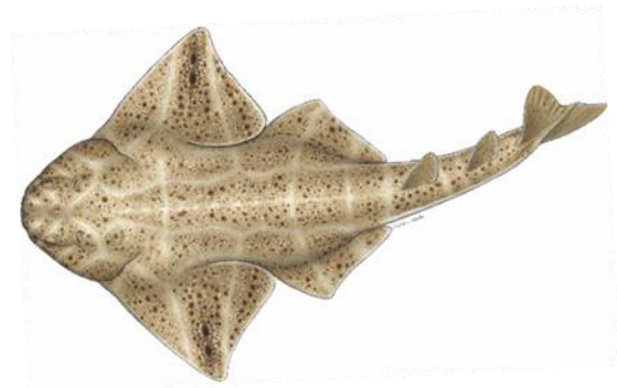
Ilustración de Marc Dando

Clase: Chondrichthyes, Subclase: Elasmobranchii Orden: Squatiniformes Familia: Squatinidae Género, especie: Squatina squatina Linnaeus, 1758