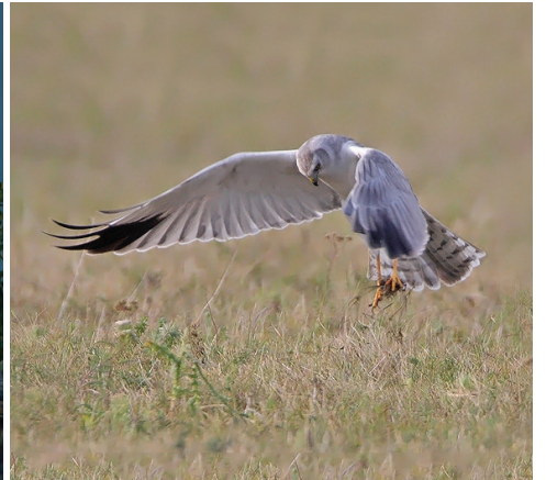
الصورة الى اليسار: البومة قصيرة الأذن (بومة صمعا)، الصورة في الوسط: الرخمة المصرية أو العقاب المصري، الصورة الى اليمين: مرزة باهنة ( مرزة بغناء )