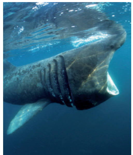
Tiburón peregrino ( Cetorhinus maximus )