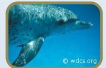
West African Aquatic Mammals