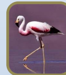
High Andean Flamingo