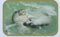
Mediterranean Monk Seal