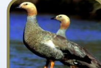
Ruddy Headed Goose