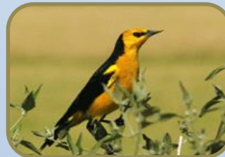
Aves de Pastizales