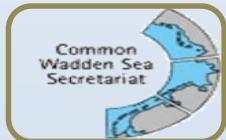
Wadden Sea Seals