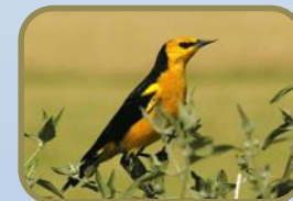
Grassland Birds of South America