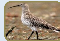
Slender- billed Curlew