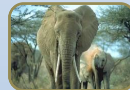
West African Elephants