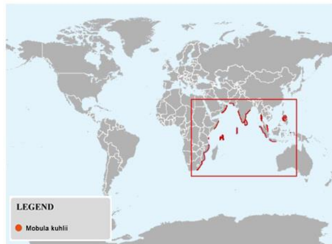
ANNEXE II. Tableau de la répartition – États de l'aire de répartition et zones de pêche de la FAO