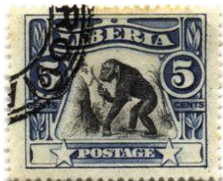
Figure 2. Timbre-poste du Libéria en 1906, illustrant l'utilisation d'outils par des chimpanzés.

Les voies utilisées à cette fin seront explorées lors de la réunion initiale décrite ci-dessus. Les moyens classiques comprennent les journaux imprimés, la télévision et l'Internet ; cependant, bien que les ordinateurs et les tablettes soient relativement rares, en particulier dans les zones rurales, les téléphones mobiles disposant d'un accès Internet sont de plus en plus répandus. Les options moins classiques à explorer comprennent une forme de « science citoyenne » semblable à celle de la « grande observation de papillons » au Royaume-Uni, dans laquelle le public saisit ses découvertes locales dans une base de données centrale. De manière encore plus imaginative, en se souvenant qu'en 1906, le Libéria a imprimé un timbre célébrant l'utilisation d'outils par des chimpanzés (Figure 2), il serait peut-être possible d'encourager la production d'un timbre équivalent ou même d'un billet de banque représentant le cassage des noix. L'Action concertée pourrait utiliser des formats différents, mais connexes dans les États de l'aire de répartition, afin de célébrer cet héritage culturel et scientifique unique.