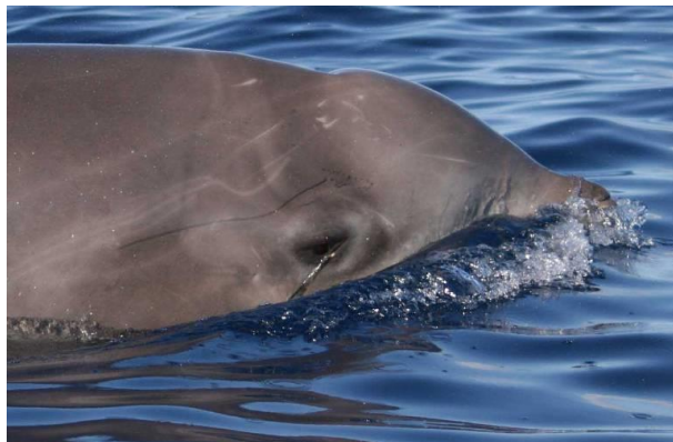
Figure 3 : Signe d'interaction avec la pêche, un hameçon d'une palangre dans la région oculaire externe d'une baleine à bec de Cuvier au large d'El Hierro, dans les îles Canaries.

Les prises accidentelles de baleines à bec ont été documentées dans différentes régions de pêche et géographiques, de la Méditerranée au Pacifique, impliquant essentiellement la baleine à bec de Cuvier mais également l'espèce Mesoplodon et des baleines à bec non identifiées (di Natale 1994; Carretta et al. 2008). Quatorze baleines à bec de Cuvier ont été notifiées comme ayant été capturées de façon intentionnelle entre 1972 et 1982 (11 dans les eaux françaises et 3 dans les eaux espagnoles), toutes tuées, dont une harponnée (Northridge 1984).