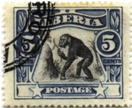
Figure 2. Timbre-poste du Libéria en 1906, illustrant l'utilisation d'outils par des chimpanzés.

Les voies utilisées à cette fin seront explorées lors de la réunion initiale décrite ci-dessus. Les moyens classiques comprennent les journaux imprimés, la télévision et l'Internet ; cependant, bien que les ordinateurs et les tablettes soient relativement rares, en particulier dans les zones rurales, les téléphones mobiles disposant d'un accès Internet sont de plus en plus répandus. Les options moins classiques à explorer comprennent une forme de « science citoyenne » semblable à celle de la « grande observation de papillons » au Royaume-Uni, dans laquelle le public saisit ses découvertes locales dans une base de données centrale. De manière encore plus imaginative, en se souvenant qu'en 1906, le Libéria a imprimé un timbre célébrant l'utilisation d'outils par des chimpanzés (Figure 2), il serait peut-être possible d'encourager la production d'un timbre équivalent ou même d'un billet de banque représentant le cassage des noix. L'Action concertée pourrait utiliser des formats différents, mais connexes dans les États de l'aire de répartition, afin de célébrer cet héritage culturel et scientifique unique.