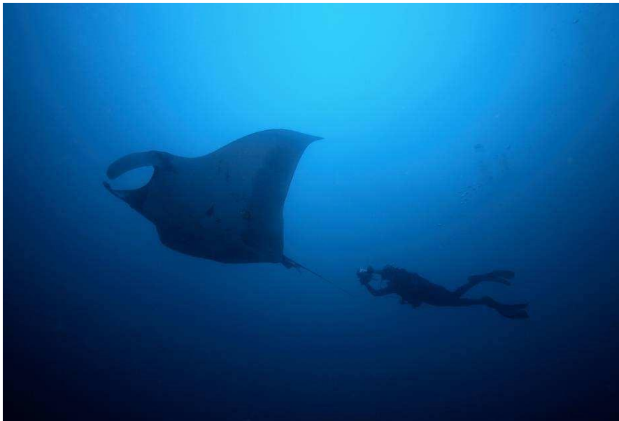
Figure 2: Plongeurs prenant des photos de Diable de mer; Parc National de Machalilla (Equateur), Photo.Felipe Vallejo, Equilibrio Azul

La demande pour cette espèce a augmenté au cours des dernières années. Les Diables de mer qui étaient habituellement considérés comme des prises accessoires sont maintenant conservés et transformés (Notarbartolo-di-Sciara 1987b; Alava et al. 2002; Marshall et al. 2006; White et al. 2006; Hilton données inédites). De nombreuses parties du corps sont utilisées pour la médecine traditionnelle, pour la production de suie et de cuir alors qu'une nouvelle demande est apparue pour ses arcs branchiaux. Cette espèce a donc été classée comme « vulnérable » sur la liste rouge de l'UICN des espèces menacées (Marshall et al. 2011).