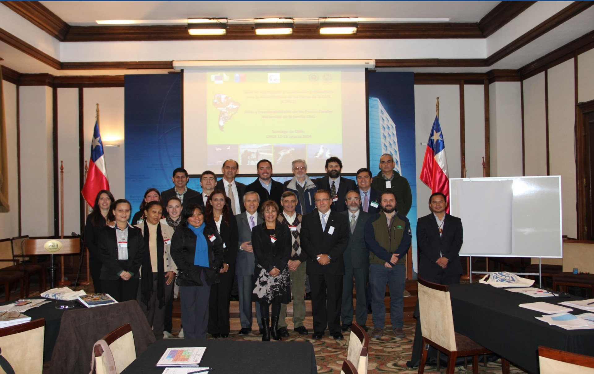
Santiago de Chile, Chile -agosto 2014 PreCOP America Latina y el Caribe