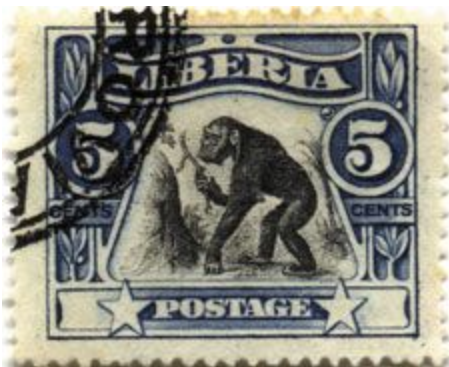
Figura 2. Sello postal de Liberia que ilustra el uso de herramientas por parte de los chimpancés, 1906.

En la reunión inicial expuesta anteriormente se explorarán las vías para este objetivo. Las oportunidades convencionales las ofrece la prensa escrita, la televisión e Internet, teniendo en cuenta que si bien los ordenadores y las tabletas pueden ser relativamente poco frecuentes en particular en contextos rurales, los teléfonos móviles con acceso a Internet son cada vez más populares. Las posibilidades menos convencionales que quedan por explorar incluyen una forma de “ciencia ciudadana” en la misma línea que actividades como la “gran observación de mariposas” en Reino Unido, en la que el público introduce sus descubrimientos locales en una base de datos central. De manera aún más imaginativa, recordemos que en 1906 Liberia imprimió un sello que celebraba el uso de herramientas por parte del chimpancé (Figura 2); tal vez se podría alentar la impresión de un sello equivalente o incluso billetes que muestren el cascado de nueces, con diferentes formatos relacionados, como acción concertada en todos los Estados del área de distribución para celebrar esta herencia científica y cultural única.