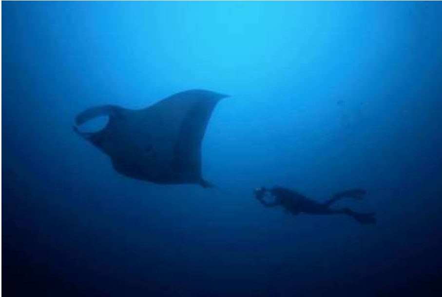
Figura 2: Buzo tomando fotos de una Manta en el Parque Nacional Machalilla (Ecuador)

La industria del turismo a nivel mundial se ha incrementado en los últimos años. En concreto, el turismo de buceo ha constituido parte de este crecimiento gracias a los avances tecnológicos y los cambios de actitud humana que han permitido al hombre experimentar la vida marina. No obstante, esta actividad no extractiva depende directamente de la conservación del ambiente marino. Por lo tanto, especies como la manta gigante se han convertido en una atracción importante en todo el mundo. En este contexto, los lugares críticos para la manta, tales como las estaciones de alimentación y de limpieza son los principales destinos del buceo en el mundo. Una industria del turismo bien administrada puede contribuir positivamente a la conservación del medio marino, a la vez que resulta económicamente rentable para las comunidades humanas que utilizan los recursos de manera sostenible (Norman y Catlin 2007).