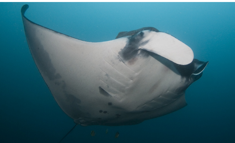
Manta diablo ( Manta birostris )

No obstante estas actualizaciones, las listas de especies migratorias aquí presentadas aún no son definitivas: se han dividido otras especies y resucitado especies antiguas, y este proceso continuará probablemente a medida que los nuevos instrumentos, en particular los análisis genéticos, se vayan aplicando de forma más amplia (p. ej. Naylor et al. 2012a, b). Por ejemplo, la raya común posiblemente migratoria del Atlántico nordoriental, Dipturus batis (Linnaeus, 1758), actualmente evaluada como en peligro crítico,