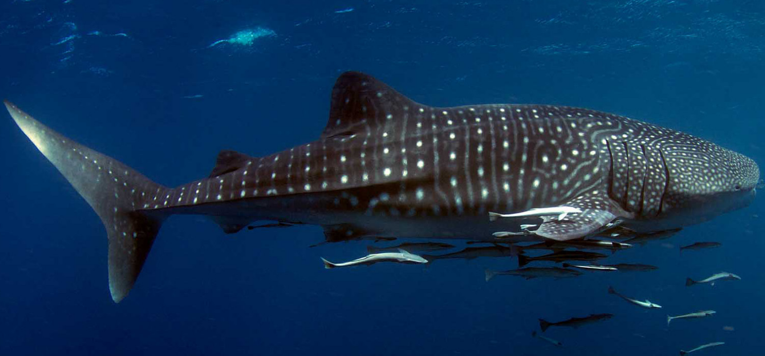
Tiburón ballena ( Rhincodon typus )

El Convenio de Barcelona es el instrumento principal para la aplicación en el Mediterráneo de las disposiciones para la ordenación sostenible de la biodiversidad costera y marina en virtud del Convenio sobre la Diversidad Biológica de 1992. En el Anexo II del Protocolo del Convenio de Barcelona para las zonas especialmente protegidas y la diversidad biológica (Protocolo SPA/BD) se incluyen las especies que requieren una protección estricta, entre ellas un número considerable de especies de tiburones. Aunque el Consejo General de Pesca del Mediterráneo (CGPM) normalmente adopta las medidas acordadas en la Comisión Internacional para la Conservación del Atún del Atlántico (CICAA), excepcionalmente, en 2012, el CGPM adoptó medidas de protección especiales para todas las especies de tiburones que figuran en el Anexo II del Convenio de Barcelona. Este es actualmente el único ejemplo de una OROP que adopta medidas de conservación de especies propuestas en un acuerdo regional sobre el mar, y sienta posiblemente un precedente interesante para la futura relación entre los acuerdos regionales de conservación de la biodiversidad y de ordenación pesquera.