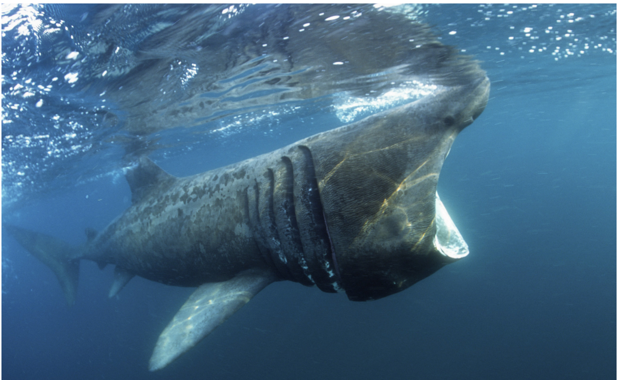
Tiburón peregrino ( Cetorhinus maximus )

En este mismo análisis general se identifican también focos de amenaza y prioridades de conservación que son también importantes para las especies migratorias amenazadas. El análisis concluye que los mares continentales de las costas tropicales mantienen los niveles de especies amenazadas más elevados, en particular a lo largo de las áreas continentales del Atlántico y el Pacífico occidental, y del triángulo